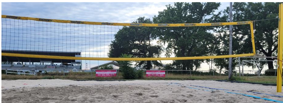
Direkte Platzierung am Spielfeldrand in direkter Nähe zur Tribüne des Rennsportsvereins.