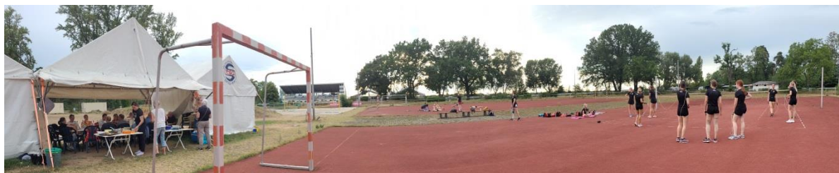
Auf dem Waldsportplatz ist immer was los: Sport, Fitness & Feiern.